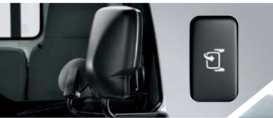
左邊電動摺合門邊鏡